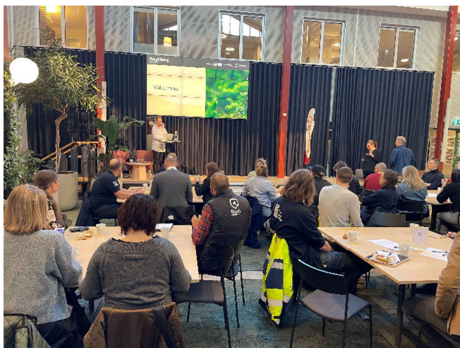
Seminarium är ett exempel på en samverkansaktivitet i vår växtbädd

Samverkan är kärnan i ByggDialog Dalarnas verksamhet och sker i olika former, på olika nivåer samt i olika konstellationer. Grunden i verksamhetens samverkan sker i den så kallade "växtbädden". Här träffas våra medlemsföretag över aktörsgränser, knyter kontakter med varandra och deltar på kunskapshöjande och inspirerande aktiviteter. Frukostmöten, seminarier, workshops och studiebesök är alla exempel på samverkansaktiviteter i "växtbädden". En djupare form av samverkan sker i våra olika temagrupper där aktörer samverkar inom olika fokusområden. Den djupaste formen av samverkan sker dock i ByggDialog Dalarnas testbäddar där aktörer från olika företag går samman. I testbäddar testar eller utvecklar företagen något som är nytt för dem och som bidrar till utveckling av samhällsbyggnadssektorn i Dalarna. Samtidigt delar företagen med sig av insikter och lärdomar till resten av branschen.