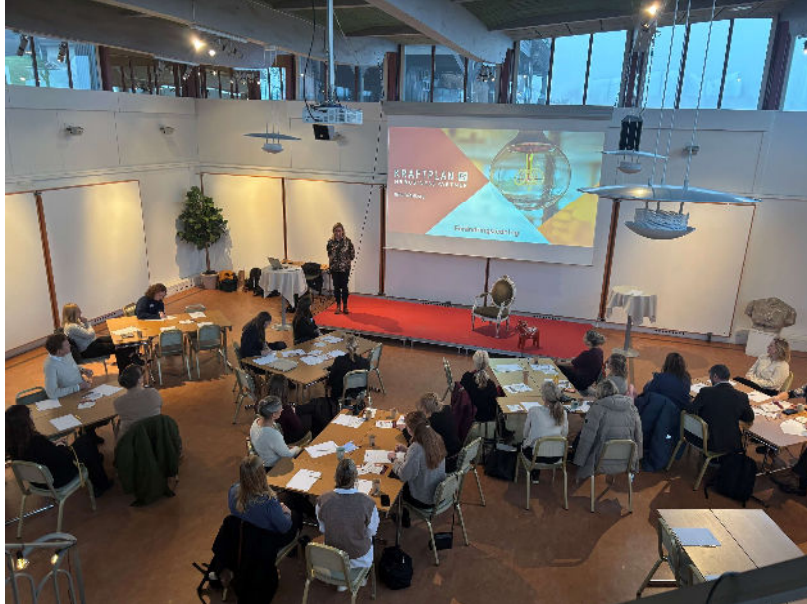
Bilder från Women building Swedens lunch- till lunchkonferens