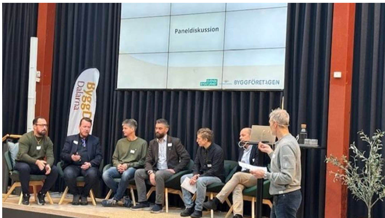
Bild från byggregeldagen med deltagare från den avslutande paneldiskussionen