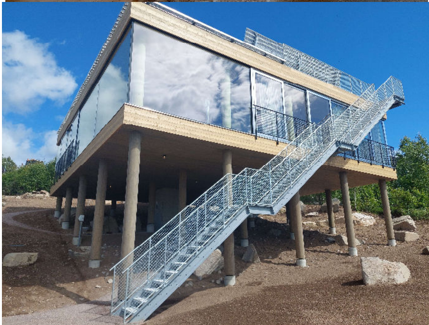
Bilder från studiebesök på villan "25 columns" i Plintberg.

Året avslutades med en lunch- till lunchkonferens där karriärresan var en av punkterna på programmet. I karriärresan intervjuas en eller flera i nätverket kring sin bakgrund, sin resa, utmaningar och möjligheter, vad man drivs av och brinner för etc. Karriärresan har visats sig vara uppskattad där man delar med sig öppenlyst av sin resa och erfarenheter. Detta stärker och utvecklar relationerna i nätverket och skapar en tillit till varandra samtidigt som det är väldigt inspirerande att få ta del av varandras berättelser. Under konferensen diskuterades även utformning av ett eventuellt mentorskapsprogram och erfarenheter från testbädden Skogstjappan (med fokus på upphandling) delades och diskuterades. Träffen avslutades med en öppen föreläsning med efterföljande workshop där aktörer utanför nätverket fick ansluta. Föreläsningen som hölls av Kraftplan hade temat förändringsledning och lockade ca 35 personer.