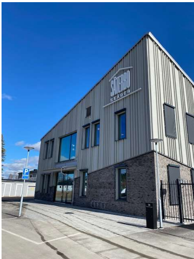
Bilder från temagruppsmöte hos Säterbostäder