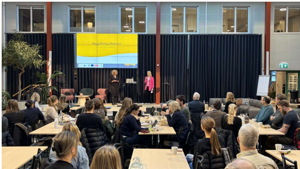
Bildtext: Spridningsevent Testbädd Skogstäppan 18/2 2025

I februari genomfördes det första större spridningseventet med omkring 45 deltagare från olika aktörer i branschen. Evenemanget hölls i Ljusgården på Dalarna Science Park och bestod av presentationer, erfarenhetsutbyte och dialog om projektets framsteg. Deltagarna fick ta del av de lärdomar som projektet genererat hittills, exempelvis vikten av tidig återbruksinventering, noggranna inventeringsprocesser, scanningsteknik och återbrukssamordning som centrala komponenter i en hållbar byggprocess.