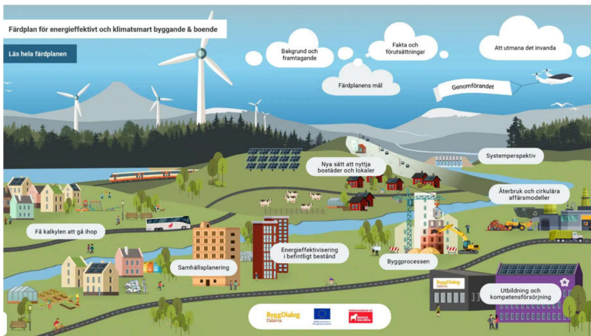
Populärversionen av Färdplan för Energieffektivt och klimatsmart byggande & boende